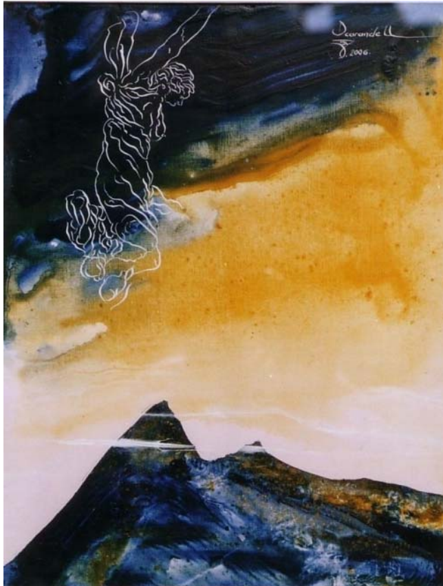
Carandell : 9 e Symphonie - Septembre 2006