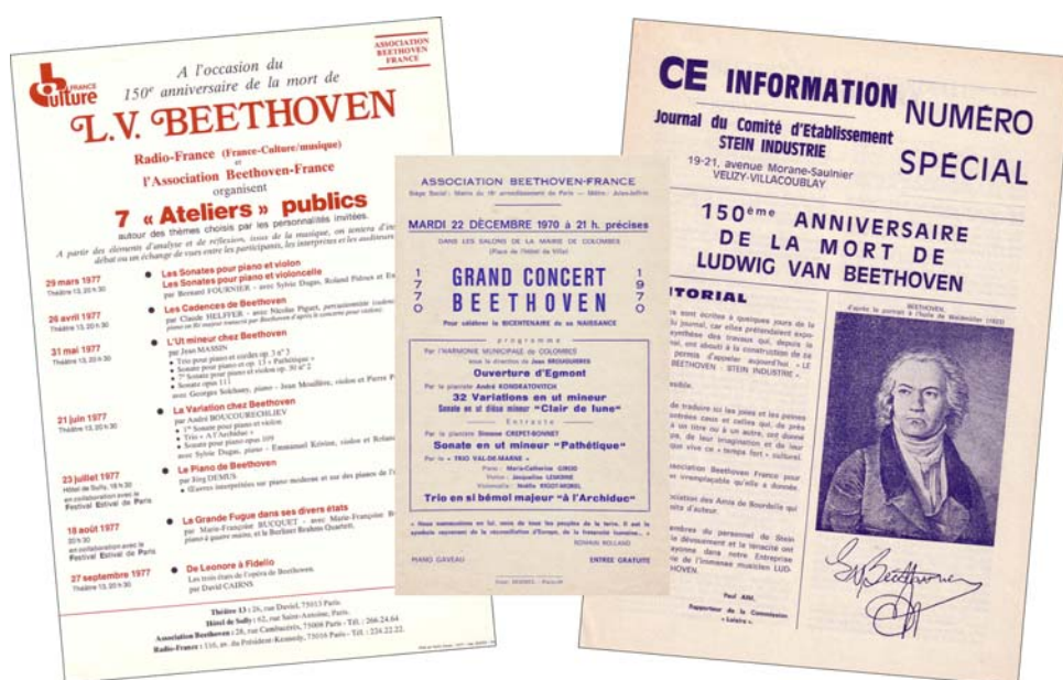
Ateliers publics avec France Culture, concerts, publications : quelques réalisations de l'Association Beethoven France

L'adhésion à l'Association Beethoven France inclut également l'abonnement à la revue de l'Association Beethoven France.