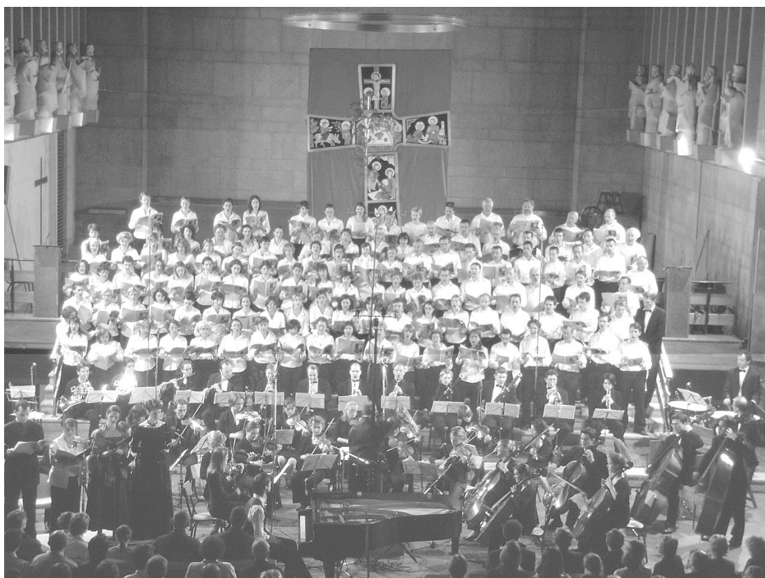
Les musiciens de l'Institut de Musique Sacrée de Lyon le Chœur de l'Université Catholique et le Chœur de l'École Normale Supérieure de Lyon.