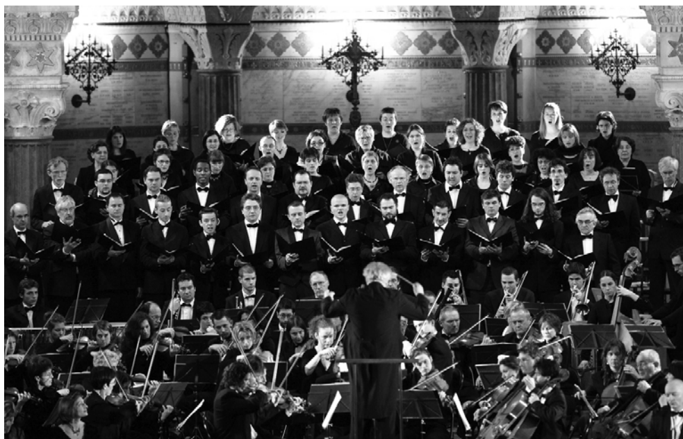
Les Chœurs et le chef

ou Weber, car on est loin d'avoir exploré toute cette fabuleuse époque ! Mais venons-en à la Messe en Ut .