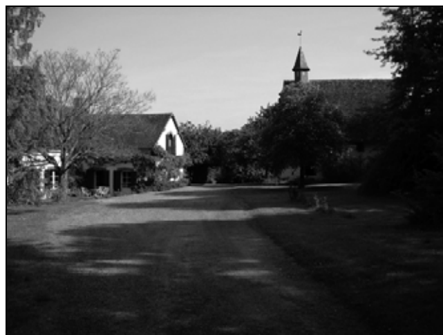
Ponessant : la maison, la propriété, la chapelle...