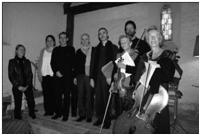
Plusieurs musiciens de la deuxième Beethovénade