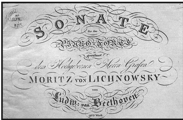
Frontispice de la Sonate opus 90