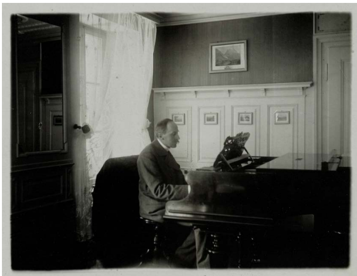
Romain Rolland au piano en 1913

16h00 : Découvrez la boutique ABF ; goûter de clôture